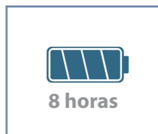
Batería de larga duración